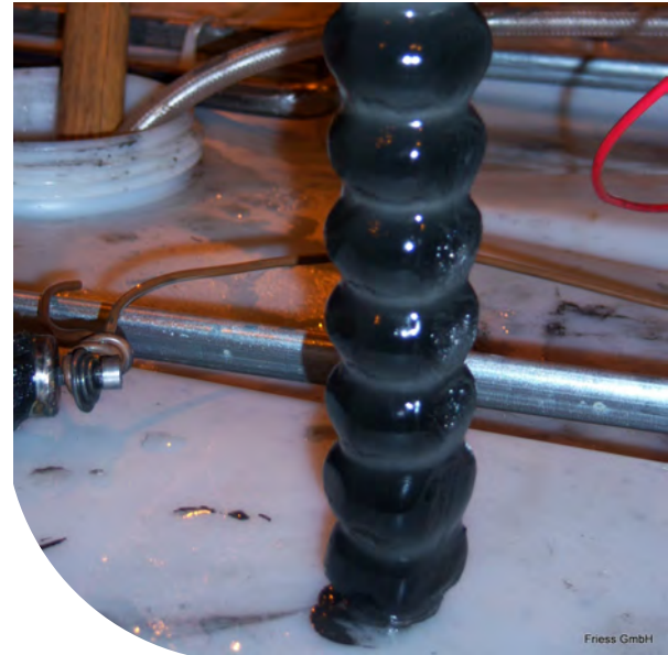
Schmutz auf Magnetfilterstäben

Hochtemperaturfeste Ausführung für Flüssigkeiten über 60 °C