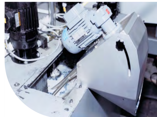
Ölskimmer mit Ablaufrutsche

Häufig schwimmen Fette & Öle vermischt mit Spänen und Schmutzpartikeln sowie andere stark klebrige Substanzen auf der Flüssigkeitsoberfläche auf. Diese klebrigen Öle und Fette werden problemlos von dem Ölskimmer entfernt, aber der Ablaufschlauch verstopft oft bereits nach kurzer Einsatzdauer. Um diese klebrigen, nicht fließfähigen Verschmutzungen schnell und einfach zu entfernen, kann der Ölskimmer Modell 1U mit einer Ölauffangwanne mit Ablaufrutsche eingesetzt werden. Aufgrund des steilen Ablaufwinkels rutscht der Schlamm problemlos in einen Auffangbehälter. Darüber hinaus kann die Rutsche leichter gereinigt werden, als eine Rohrleitung oder ein Ablaufschlauch.