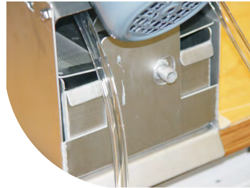
Ölskimmer mit Ölabscheider

Insbesondere bei Entfettungsanlagen muss die Badoberfläche frei von aufschwimmenden Ölen sein, um eine optimale Reinheit der Oberflächen der zu waschenden Teile zu gewährleisten. Der Ölskimmer muss also ständig die aufschwimmende Ölphase entfernen. Da die aufschwimmende Ölschicht häufig sehr dünn ist, wird mit dem Öl ein gewisser Anteil an Waschwasser abgescummt. In dem integrierten Abscheider setzt sich das Waschwasser ab und wird wieder in den Arbeitsbehälter zurückgeleitet, während das Öl in einen Sammeltank abläuft. Der Austrag an Waschwasser wird reduziert und die zu entsorgende Menge an Altöl wird verringert.